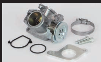
ビッグスロットルボディークイット