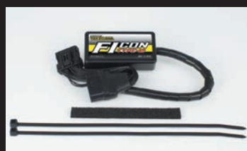
FIコンTYPE-e(インジェクションコントローラー)