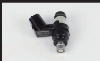
フューエルインジェクターASSY.(G-1)