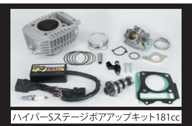
ハイパーSステージボアアップキット181cc