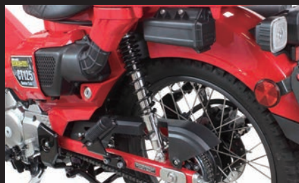
装着写真(ブラック塗装)

※本製品を装着した場合、マフラーと地面の距離が近くなります。カーブや段差等通過時にマフラーが地面と接触する恐れがあるので、注意して下さい。