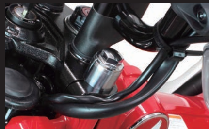
フロントフォーク突き出し量:20mm