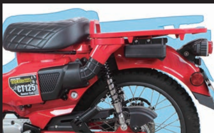
装着写真(シート高:約40mmダウン)