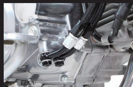
装着写真(オイル取り出し口)