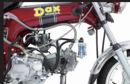
装着写真(3フィン4オイルライン)