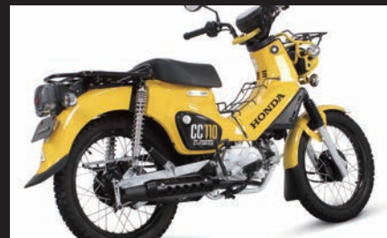
装着写真(クロスカブ110/ブラックプロテクター)