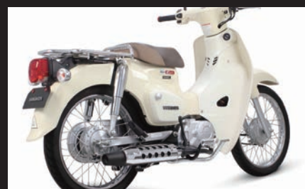
装着写真(スーパーカブ110/メッキプロテクター)