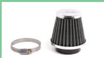
エアフィルター-TYPE-1(ペーパー)