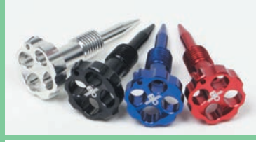
アルミ削り出しエアスクリュー