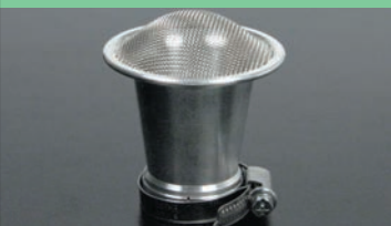
大口徑ビレットエアファンネル(ネット有り)