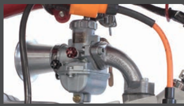
装着写真(モンキー)