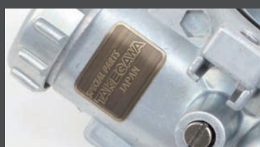
ブロンズエッチングプレート装着