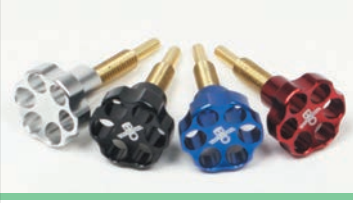
アルミ削り出しアイドルアジャストスクリュー