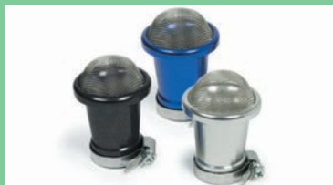
ビレットエアファンネル(ネット有り)