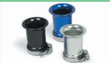
ビレットエアファンネル(ネット無し)