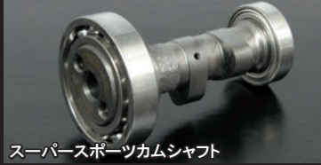
スーパースポーツカムシャフト