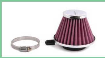
エアフィルター-TYPE-2(ペーパー)