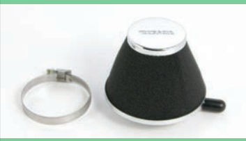
ハイフローフィルター(スポンジ)