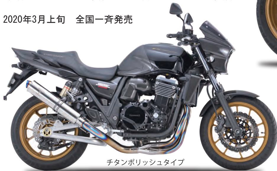
チタンポリッシュタイプ

タイプ アールズギア ワイバンクラシックR チタンポリッシュ アールズギア ワイバンクラシックR チタンドラグブルー