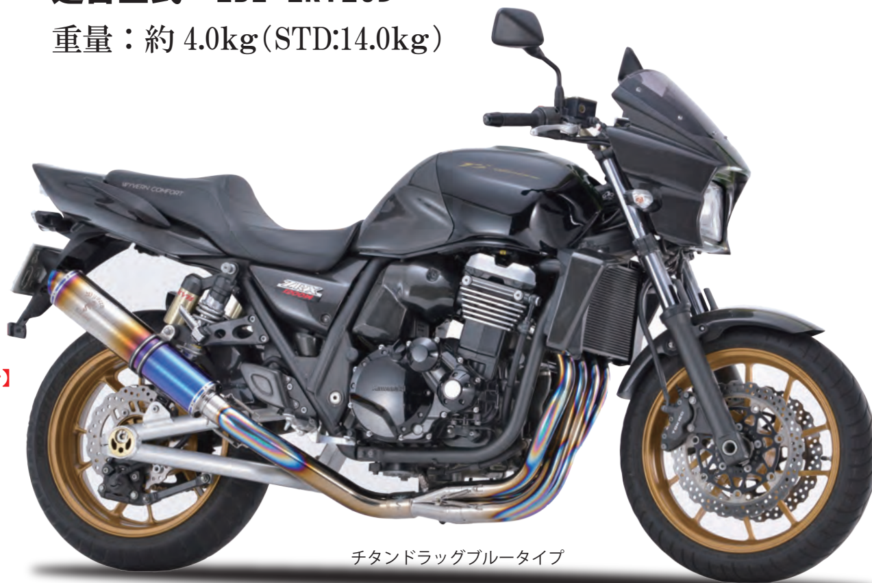
チタンドラグブルータイプ