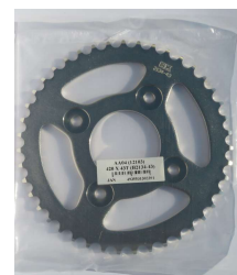
ドライブスプロケット(1 ケース 10 枚入り)