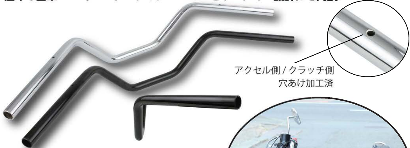
アクセル側 / クラッチ側 穴あけ加工済

発売以降、大好評の W800 W1 バー、新たにスチール製/メッキ仕上げを新設定。 往年の名車、W1 のハンドルディメンションをボルトオン設計にて再現。