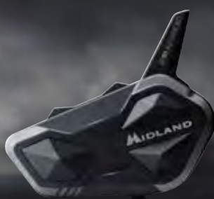
BT R1 ADVANCED