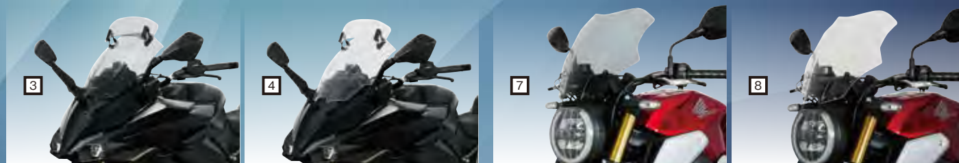
可変フラップで風の流れをコントロールできるスクリーンヴァリオツーリング