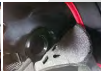
スピーカーホール等現代装備に対応