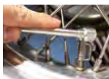
バルブに押し込むだけで自動で ホールドされるオートエアチャック