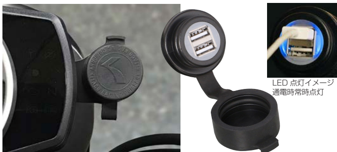
LED点灯イメージ 通電時常時点灯

※GB350S (7月15日発売)の適合は現在未確認です。改めてお知らせいたします。 ※完全防水ではありません。洗車・雨天時は使用しないで下さい、また使用しないときは必ず付属のゴムキャップをする事。 ※温度変化等により本体(ゴムキャップ)内部に結露が発生する恐れがあります。温度変化の激しい場所は避け、こまめに確認し水滴は除去してください。(エアダスター、掃除機等で水滴を除去して下さい) トラブルの原因になる可能性があります。