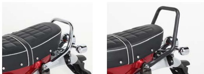
ノーマルグラブバー

※下記の弊社製品と併用可能。 ● ヘルメットホルダー (80-564-13200) (上記参照) ● サイドバックサポート (80-655-13201) (上記参照)