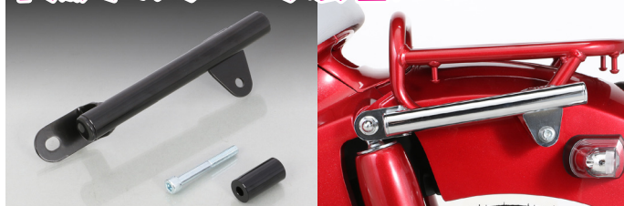
市販ホルダー等の装着に便利なグラフバーです。