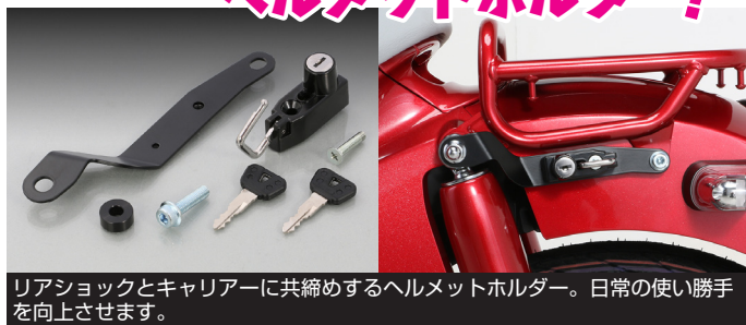
リアショックとキャリアに共締めするヘルメットホルダー。日常の使い勝手を向上させます。

スーパーカブ C125 (JA48/58) 用! K・TOUR より販売開始 出先での使用に便利な ヘルメットホルダー!