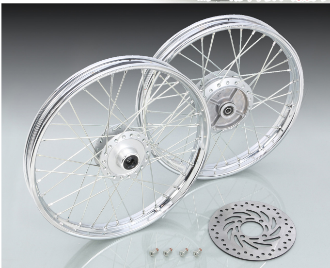
キャストホイールからスポークホイールへスタイルチェンジするキットです。

※ノーマルキャリパー対応。デモ車には2POTキャリパー ASSY (レッド:500-1310220) を装着しています。