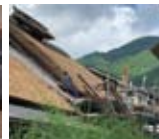
※大内宿 囲炉裏で焼かれる しんごろう 茅葺屋根の修理風景