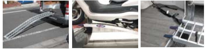
積み降ろしもスムーズ