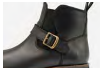
くるぶしにはクッションパッド内蔵。