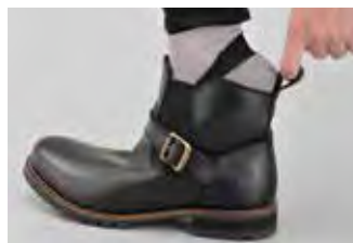
脱ぎやすいサイドゴア。