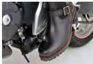
外皮の内側にシフトパッド装備。