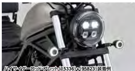
ハイサイターヘッドブラケット (15336) + (95823) 装着例

フロントフォークウインカーブラケット、カブラーのセット。ウインカーは付属しません。