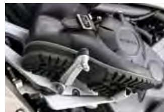
ソールステップ部に滑り止め加工。