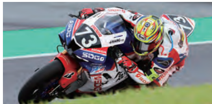
#73 SDG HONDA Racing