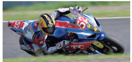
#52 TERAMOTO@ J-TRIP Racing