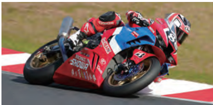
#88 HONDA ASIA Dream Racing with SHOWA