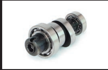
スポーツカムシャフト