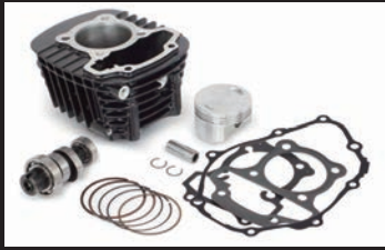
Sステージキット145cc(カムシャフト付属)

吸入効率を高め、ノーマルエンジン、カスタムエンジンのどちらのエンジン仕様であっても出力性能が向上します。純正エアクリナーボックスに繋がるコネクティングチューブを取外し、スロットルボディに直接装着します。エアフィルター本体にはブローバイユニオンがついている為、付属のユニオンやホースを用いることで、ブローバイホースに接続できます。エアフィルターはブラックエレメントとレッドエレメントの2種類。 ※ノーマルエンジン、ノーマルマフラーの車両に本製品を装着する場合、FIコンTYPE-X(インジェクションコントローラー)の同時装着は必要ありません。 ※オフロード走行を行うことは出来ません。 ※カスタムエンジン車(カムシャフト/ボアアップ)、又はSP武川製各種マフラーを本製品と同時装着する場合、FIコンTYPE-X(インジェクションコントローラー)の同時装着が必要になります。 ※ノーマルエアクリナーへ接続されているコネクティングチューブを取外す必要があります。※エアクリナーケースは、エアクリナーガーニッシュを固定する為、取外さず残す必要があります。