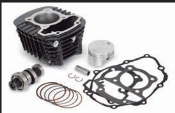
Sステージキット145cc(カムシャフト付属)

■ノーマルエンジン、ノーマルマフラーの車両に本製品を装着する場合、FIコンTYPE-X(インジェクションコントローラー)の同時装着は必要ありません。 ※オフロード走行を行うことは出来ません。 ※カスタムエンジン車(カムシャフト/ボアアップ)、又はSP武川製各種マフラーを本製品と同時装着する場合、FIコンTYPE-X(インジェクションコントローラー)の同時装着が必要になります。 ※ノーマルエアクリナーへ接続されているコネクティングチューブを取外す必要があります。※エアクリナーケースは、エアクリナーガーニッシュを固定する為、取外さず残す必要があります。