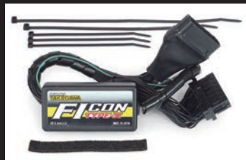
FIコンTYPE-X(インジェクションコントローラー)