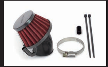
エアフィルターキット(レッドエレメント)