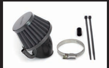
エアフィルターキット(ブラックエレメント)