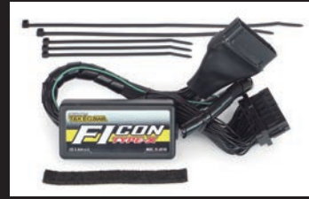
FIコンTYPE-X(インジェクションコントローラー)