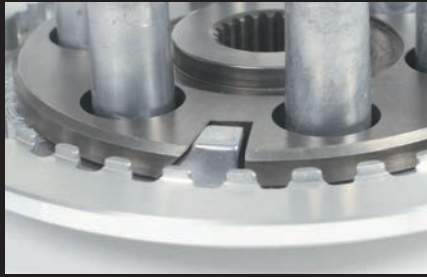
クラッチセンター内部作動イメージ(通常状態)