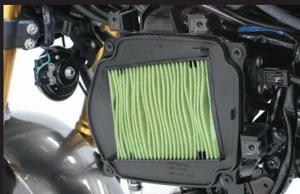
ノーマルエアクリーナーボックス内の純正エレメント