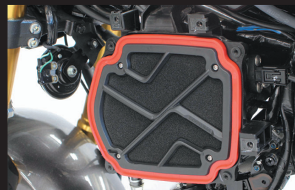
パワーフィルター装着時