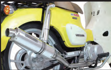
装着写真(スーパーカブ110)