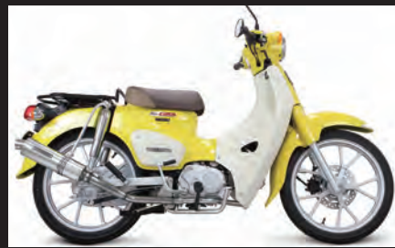
装着写真(スーパーカブ110)