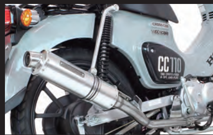
装着写真(クロスカブ110)