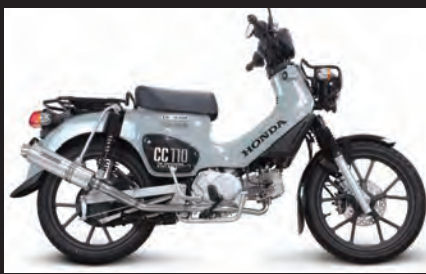
装着写真(クロスカブ110)