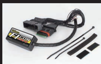
FIコン TYPE-e(インジェクションコントローラー)