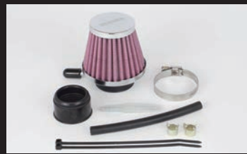
エアフィルターキット