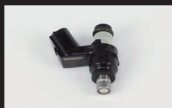
フューエルインジェクター(G-1)