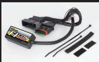
FIコンTYPE-e(インジェクションコントローラー)