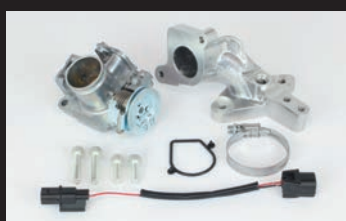
ビッグスロットルボディークット