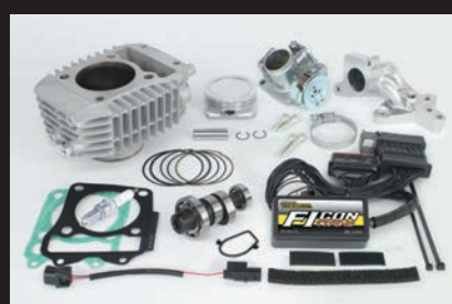
ハイパーSステージボアアップキット181cc