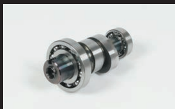
スポーツカムシャフト(N-20)