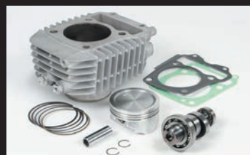
Sステージボアアップキット181cc