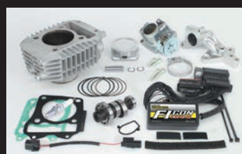
ハイパーSステージボアアップキット181cc