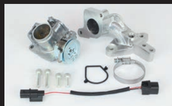
ビッグスロットルボディークット