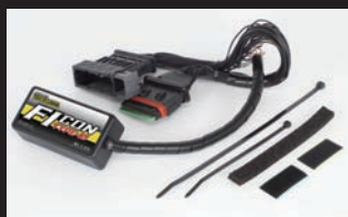
FIコン TYPE-e(インジェクションコントローラー)