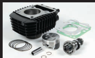
eステージボアアップキット143cc