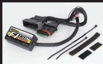
FIコンTYPE-e(インジェクションコントローラー)