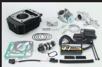
ハイパーeステージボアアップキット143cc