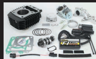
ハイパーeステージボアアップキット143cc