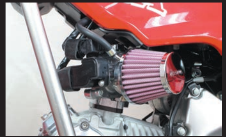
装着写真 (別売エアフィルターキット)