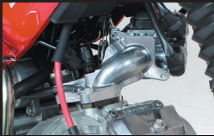
装着写真 (SP武川オリジナルニホルド)