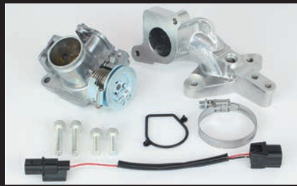
ビッグスロットルボディーキット

純正エアクリナーボックスに繋がるコネクティングチューブを外し、スロットルボディーに直接装着するエアフィルターキットです。本製品を装着することで吸入効率が向上し、高回転での出力アップが可能となります。エアフィルター本体にはブローバイユニオンがついている為、付属のユニオンやホースを用いることで、ブローバイホースに接続できます。