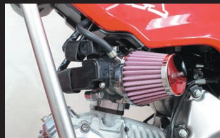
装着写真(SP武川製ビッグスロットルボディ)