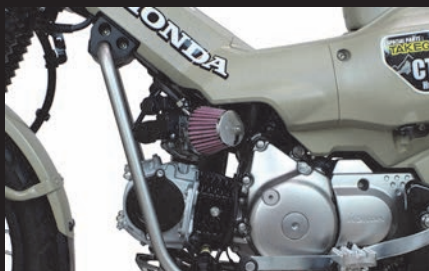
装着写真(ノーマルスロットルボディ)