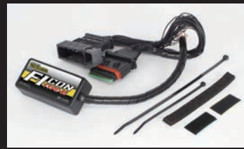
FIコンTYPE-e(インジェクションコントローラー)