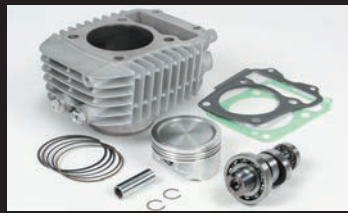
Sステージボアアップキット181cc