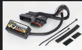
FIcon TYPE-e(インジェクションコントローラー)