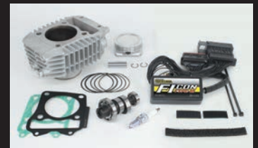
Sステージαボアアップキット181cc