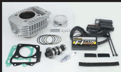
Sステージαボアアップキット181cc