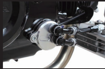
装着写真(オイル取り出し口)